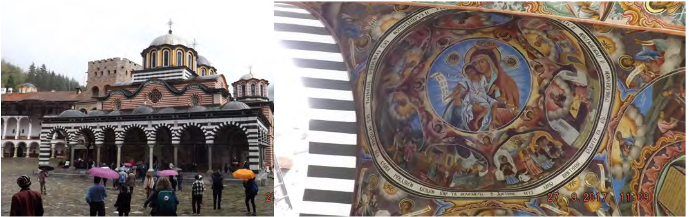
Monastère de RILA

Après notre arrivée à SOFIA et l'installation à l'hôtel, quartier libre, ainsi nous partons en direction du centre ville à la découverte de la capitale. L'empreinte de l'URSS est bien visible, une large avenue nous emmène vers le cœur de la cité. Nous découvrons le Marché Couvert (cliché de D) et la colonne avec la statue de « Sophie » Sainte patronne de la ville (cliché de G).