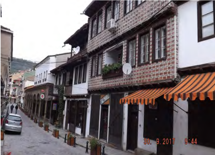
Une rue de la vieille ville de Veliko.