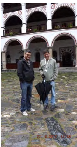
Même pas en panne